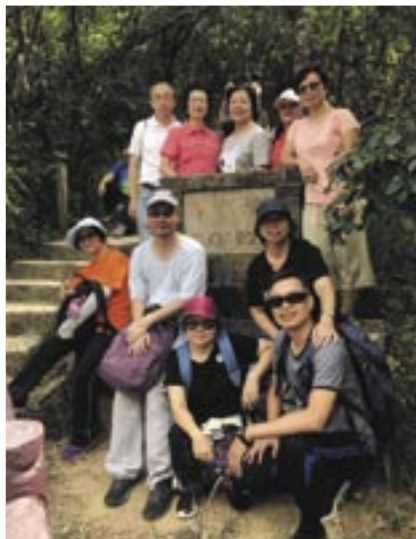
加恩橋戶外鬆一鬆