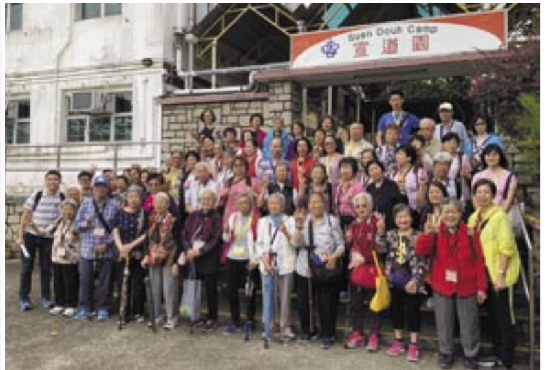
中心與教會福音日營