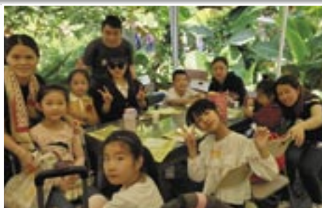
菠蘿園中學習種植