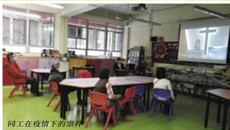
同工在疫情下的崇拜