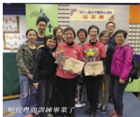
短宣粵曲訓練畢業了