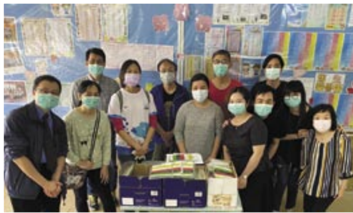
心動踐行：預備出隊