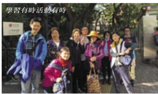
學習有時活動有時