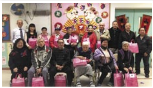
2020年致送「福袋」予長者