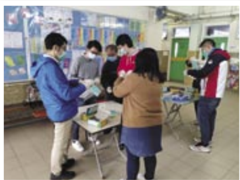
心動踐行：包裝口罩