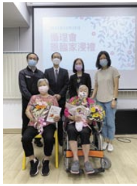
院舍肢體回「家」探望