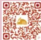
Alipay 單次捐款 Alipay 月捐—孤長開飯啦 Payme 單次捐款