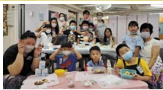
學生考試完結有興趣班,讓他們鬆一鬆