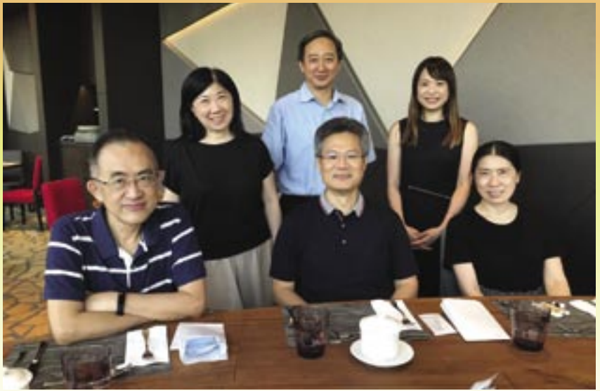
王牧師任期中，其中一屆訓導委員會成員，當中有三位牧師和三位信徒代表

王牧師說，過往一直見證著循理會的肢體，滿有愛心。「我們循理會亞洲區總監常說香港循理會議會是一個慷慨的議會，無論不同地區的天災人禍，或是慈惠、事工發展，當肢體看到那些需要，都甘心樂意奉獻，分享神賜下的恩典。」屈指一算，例如：當台灣某年生重大天然災害，我們在短