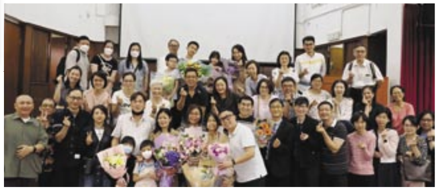
葵涌堂聯合水禮集體合照