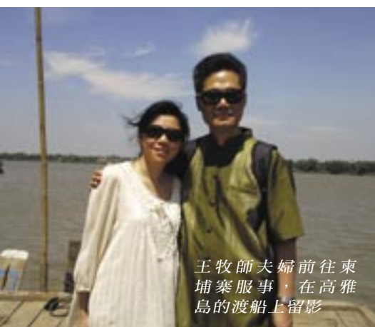
王牧師夫婦前往東埔寨服事，在高雅島的渡船上留影

2024年即將迎來香港循理會白金禧，我們邀來循理會會長王呂生牧師回顧教會發展史，最適合不過。王牧師在神學院畢業後，便進入本會事奉，至今已歷卅七年寒暑，切切實實地見證教會的發展與挑戰；同時，王牧師歷任議會基教部及差傳部部長等重要崗位，不同的事工建立了許多弟兄姊妹，他娓娓道來四件感恩難忘往事，也側面觀照本教會逾一半時期的歷史，兼具闊度與深度，難能可貴。