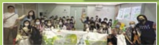
竹福呈暖流——端午探訪