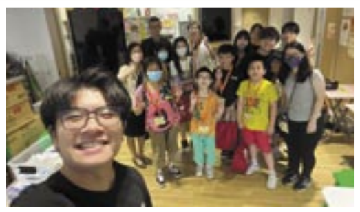
大豆參與中心派飯