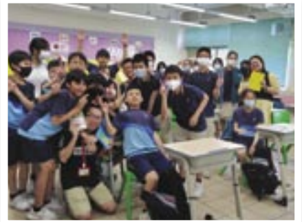
美林小學校園福音工作