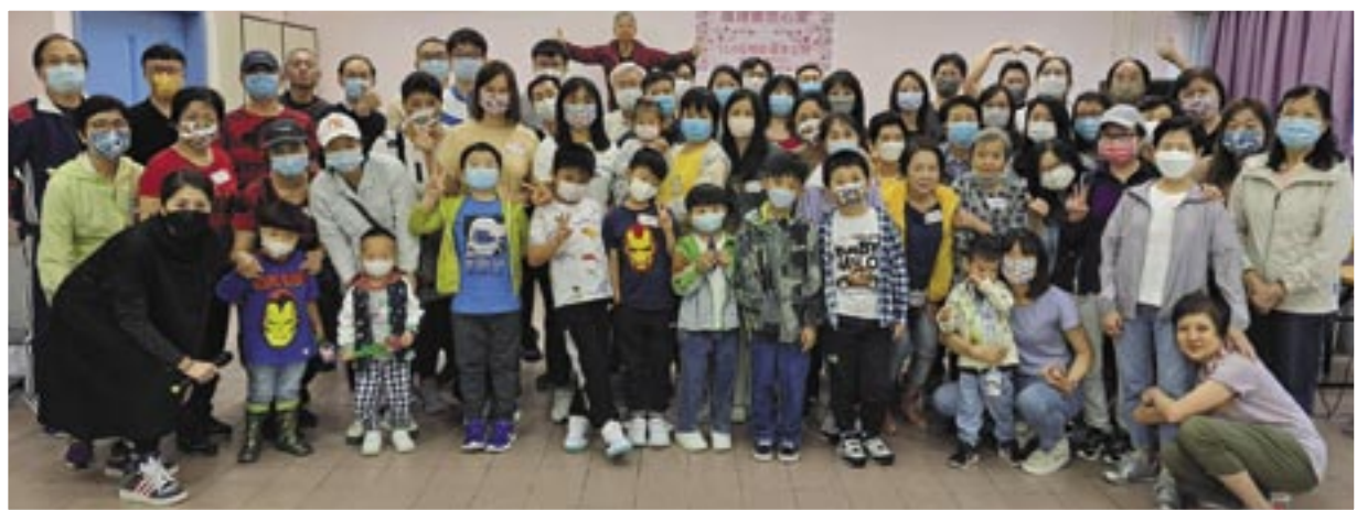
母親節福音主日，有30多位來賓參與