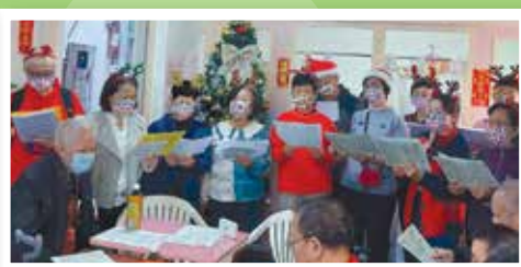
老人院舍探訪·獻唱福音粵曲