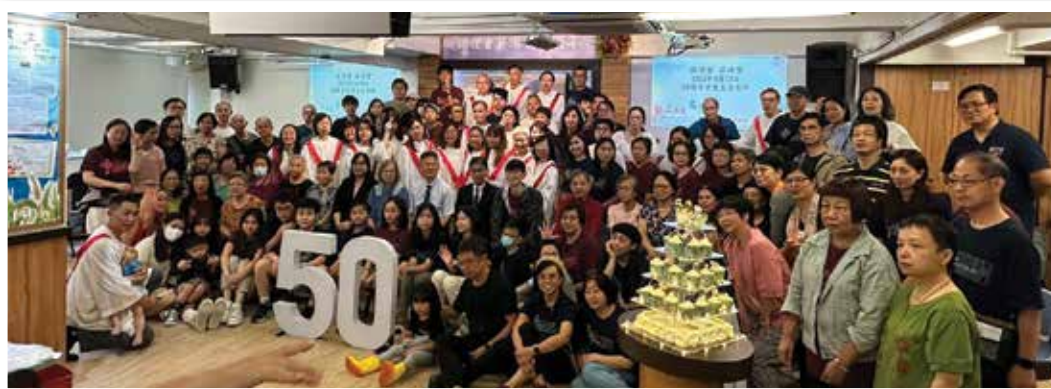
五十周年晚宴合照