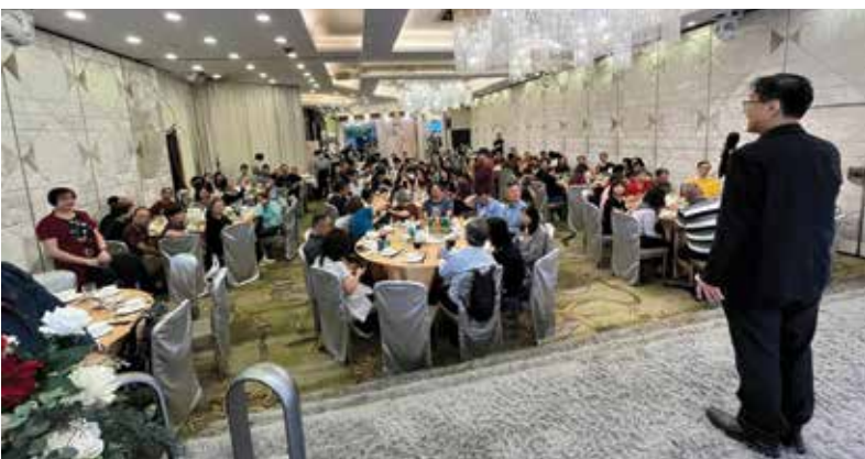
五十周年晚宴照片