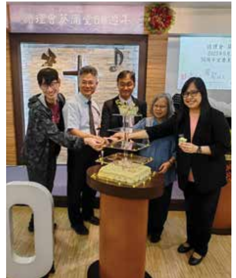
五十周年堂慶崇拜傳道同工合照

除了以上屬靈新衣所需的五種品德，保羅在歌羅西書三14更呼籲「要穿上愛心」，因為愛心就是聯絡全德的。肢體連結屬靈的品德，需要「不住的愛」，假若「愛」缺了「心」，變成「不住的受」。求主幫助教會肢體穿上新衣，彼此相愛。