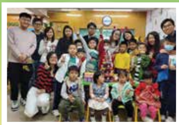
聖誕Party·學生、老師 及教會肢體同歡樂