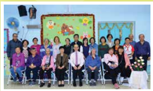
2023年長者主日大合照