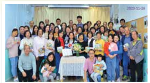
郭姑娘分享話別會