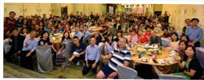
五十周年教會大合照