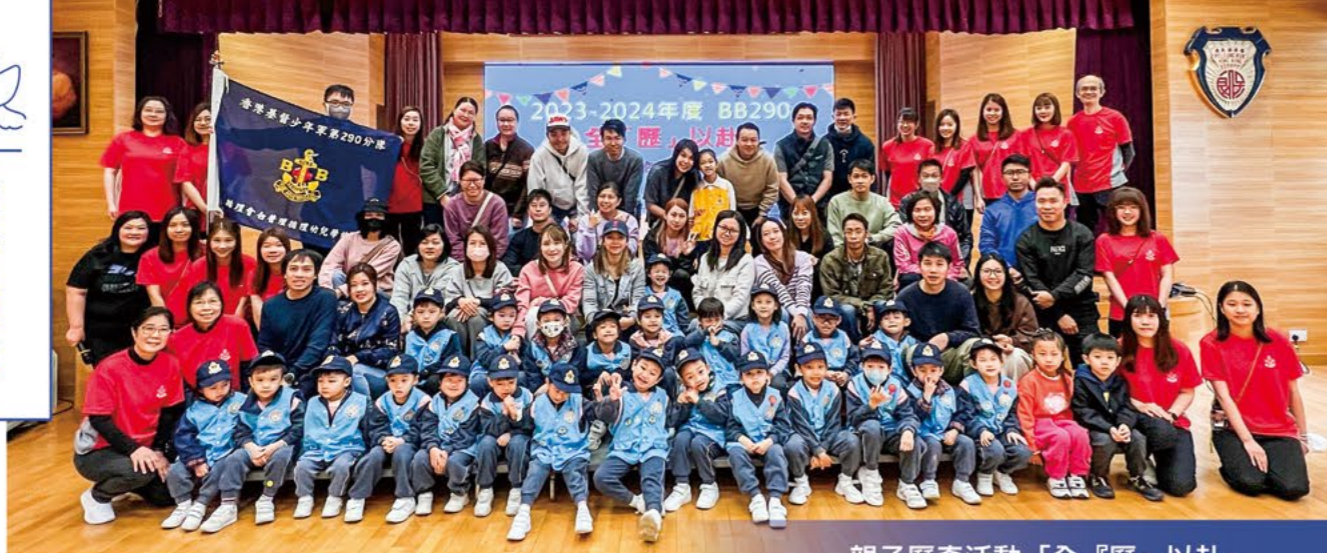
親子歷奇活動「全『歷』以赴」