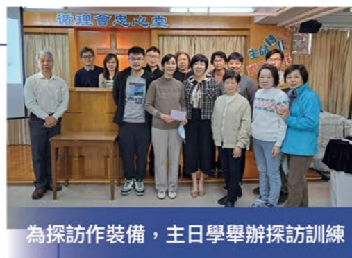
為探訪作裝備，主日學舉辦探訪訓練