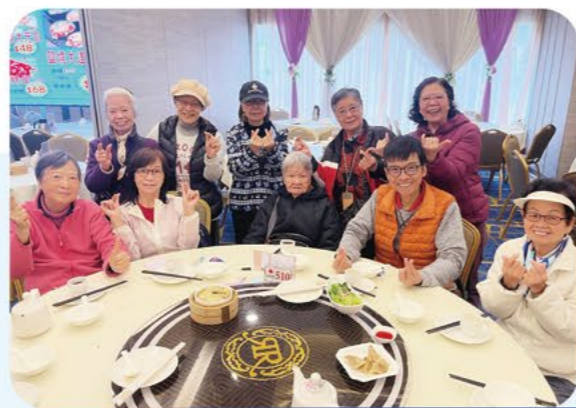
長者團契（路得團）會後聚餐