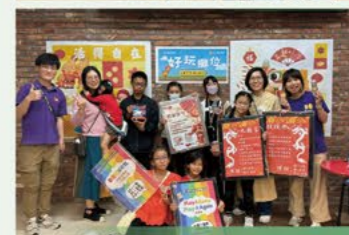
迷你年宵好玩攤位