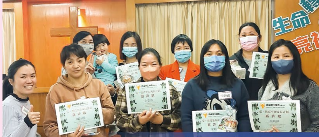
我們畢業了！愛燃亮婦女成長班