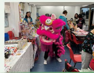
迷你年宵暨舞獅小組表演