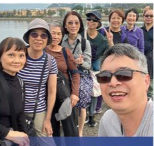
加恩橋(成人組)活動